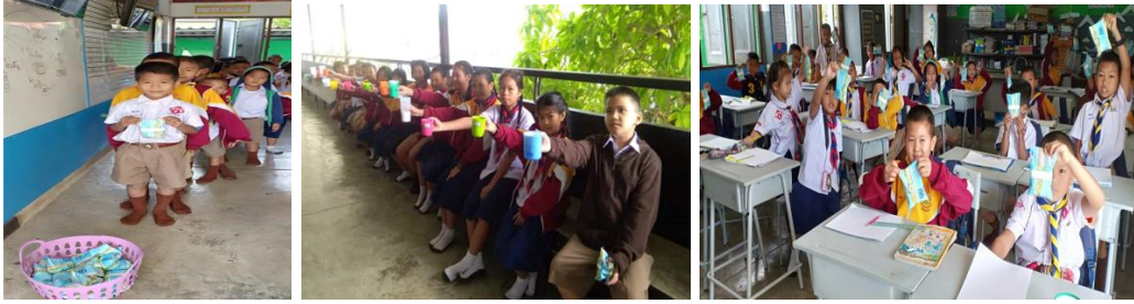
๘. โครงการสนับสนุนค่าใช้จ่าย ในการบริหารสถานศึกษา ศูนย์พัฒนาเด็กเล็กเทศบาล ตำบลหนองหาร