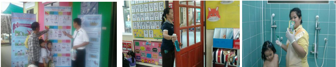
๑๐. โครงการพัฒนาศักยภาพการเรียนรู้ นอกสถานศึกษาของเด็กนักเรียน ศูนย์พัฒนาเด็กเล็กเทศบาลตำบลหนองหาร